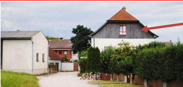
Klosterhof Eisengraben 10 3542 Gföhl

Ihr bleibt auf der B37 Richtung Zwettl bis ihr kurz nach Gföhl (nicht nach Gföhl hinein abbiegen, sondern auf der B37 bleiben!) auf der rechten Seite einen Abzweiger „Eisengraben“ seht. Den nehmt ihr und folgt der Landstraße einige km bis zum Ortsschild „Eisengraben“. Gleich nach dem Ortsschild biegt ihr links ab. Nun habt ihr auf eurer rechten Seite Häuser und auf der linken Wiesen/Felder. Ihr fahrt solange die Straße entlang, bis auf der linken Seite auch Gebäude sind – dann habt ihr rechts von euch bereits unsere Hausmauer und müsst nur noch scharf rechts in den Hof hinein abbiegen. Der Klosterhof ist übrigens das höchste Haus, das ihr sehen könnt.